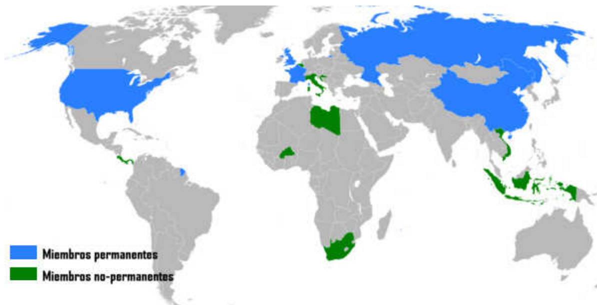
Mapa 2 Membresía del Consejo de Seguridad durante el año 2008